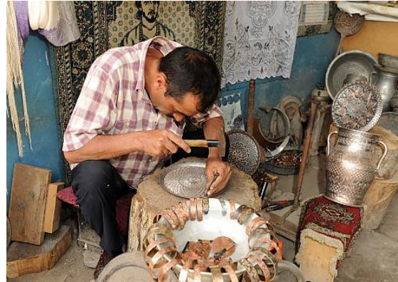
Copper craftsmanship of Lahij