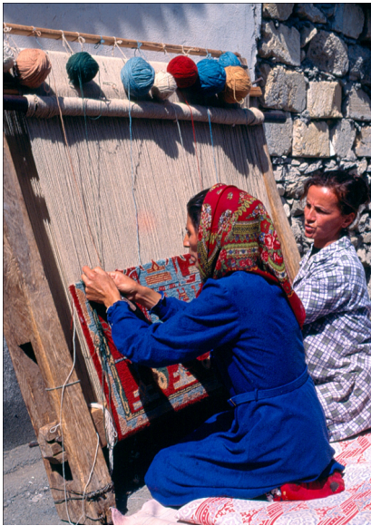
Traditional art of Azerbaijani carpet weaving