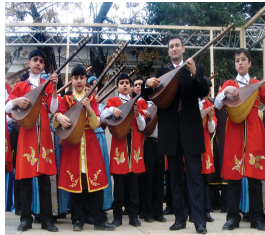
Art of Azerbaijani Ashiq