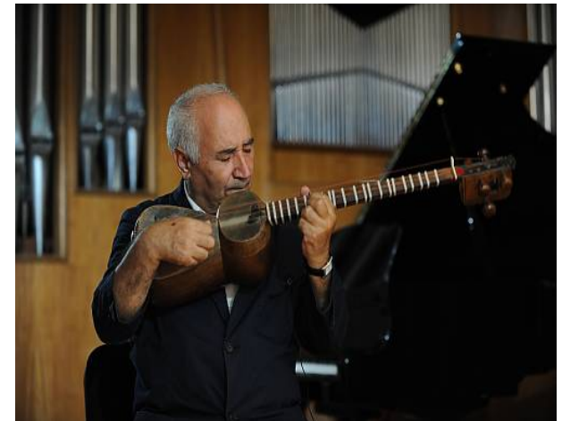
Craftsmanship and performance art of the Tar, a long-necked string musical instrument