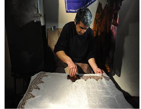
Traditional art and symbolism of Kelaghayi, making and wearing women's silk headscarves